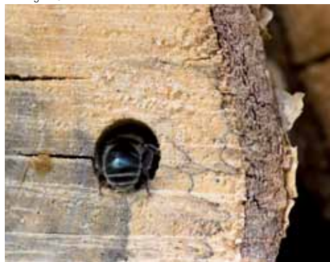
Abeille sauvage confectionnant son nid dans un trou creusé à la perceuse.