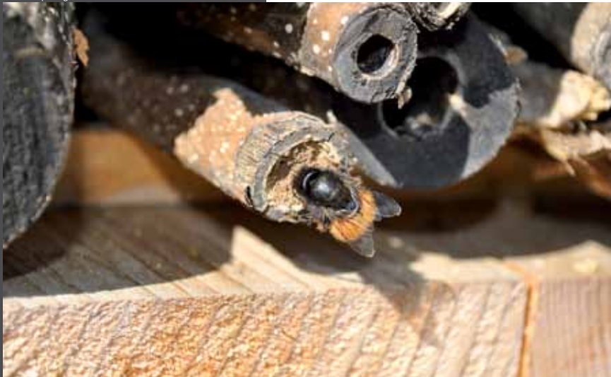
Abeille sauvage Osmia sp. finissant de boucher son nid avec de la boue.