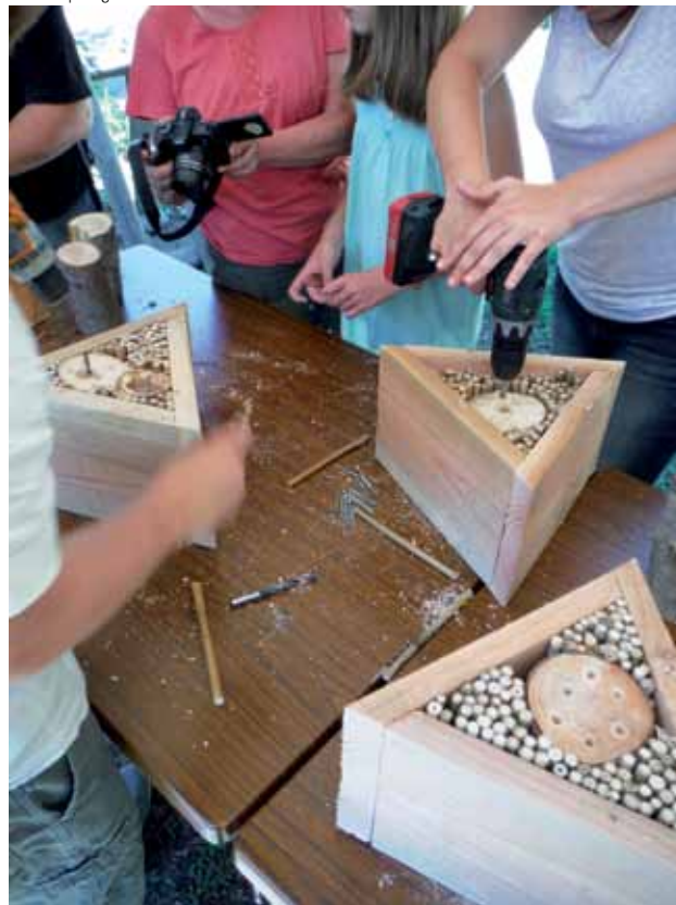
Fabrication de nichoirs avec les enfants lors d'un atelier.