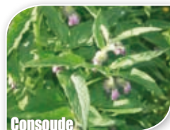
Consoude [Symphytum officinale]

Afin de lutter efficacement contre les petits ravageurs des plantes (acariens, pucerons...), favorisez l'installation d'animaux auxiliaires (coccinelles, carabes, chrysopes, syrphes, hérissons, oiseaux...), qui se révéleront de précieux alliés du jardin naturel.