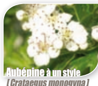
Aubépine à un style ( Crataegus monogyna )