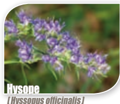
Hysop [Hyssopus officinalis]

Comme nous l'avons vu, les abeilles et autres insectes floricoles peuvent trouver toute leur nourriture sur les fleurs des espèces de plantes locales . En somme, les insectes trouvent normalement tout ce dont ils ont besoin dans la nature. Aussi, il serait prétentieux de lister ici de manière exhaustive toutes les plantes à fleurs que vous pouvez installer et qui ont un intérêt pour les abeilles. Toutefois, nous vous proposons quelques suggestions pour vos plantations en bacs ou en pleine terre.