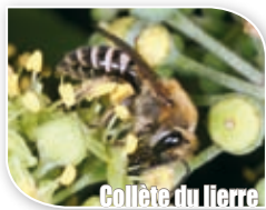
Colète du lierre [ Colletes hederæ ]

La grande diversité des abeilles et le nombre considérable d'espèces décrites à ce jour (près de 1000 pour la France) rendent la plupart des abeilles difficiles à déterminer et une observation minutieuse de caractères précis par des spécialistes est généralement indispensable.