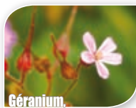
Géranium Herbe à robert ( Geranium robertianum )