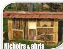
Nichoirs & abris