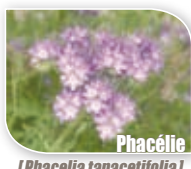
Phacélie ( Phacelia tanacetifolia )