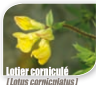
Lotier corniculé ( Lotus corniculatus )