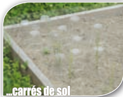
...carrés de sol