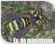
Ex. de mimétisme chez un papillon (Sesia)

Pour se protéger des prédateurs, la sélection naturelle a favorisé chez certains animaux l'allure d'animaux venimeux. C'est le cas de nombreux insectes (certains papillons, tenthrèdes et syrphes...) qui ressemblent à s'y méprendre à des hyménoptères venimeux redoutés (abeilles et guêpes) alors qu'ils n'ont pas de dard. D'autres animaux survivent grâce à une ressemblance plus ou moins prononcée avec leur environnement afin de pouvoir mieux se dissimuler (phasmes, insectes feuilles, amphibiens...).