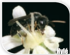
Hylé [ Hylaeus sp.]

Colletes hederæ butine exclusivement le lierre, elle ne s'observe donc qu'à l'automne lors de la floraison de la plante.