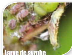
Larve de syrphie [Syrphidés]

Le jardin peut être conduit grâce à des méthodes alternatives diversifiées, qui ne nuisent pas à la nature et qui permettent à la biodiversité de jouer naturellement son rôle.