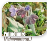
Pulmonaire [Pulmonaria sp.]