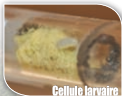
Cellule larvaire (en construction)

Sur ces sites d'étude, nous préconisons une gestion en faveur de ces pollinisateurs.