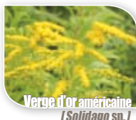
Verge d'or américaine ( Solidago sp. )