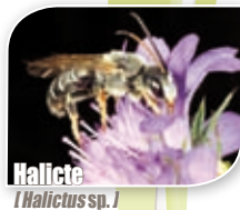
Halicte [ Halictus sp.]

✚ Ces abeilles sont majoritairement solitaires bien que certaines soient sociales à des degrés divers. Une femelle dominante pond les œufs et les autres femelles réalisent le reste des tâches comme le butinage, la collecte. Les femelles d' Halictus et de Lasioglossum se distinguent grâce au sillon glabre à l'extrémité de leur abdomen. Les mâles, plus fins, ont de longues antennes. La nidification est terricole.