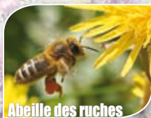
Abeille des ruches ( Apis mellifera )