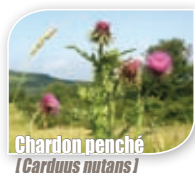
Chardon penché [Carduus nutans]

Chaque territoire recèle quantité de plantes sauvages riches en nectar et en pollen. Les espèces très communes de nos jardins et bords de routes ne sont pas à négliger, notamment en fin d'hiver (période de vache maigre pour les butineurs), car elles fournissent une nourriture indispensable pour les abeilles en particulier et beaucoup d'autres insectes . Ainsi, pour offrir aux insectes floricoles une nourriture variée, il convient d'associer les différentes familles de plantes afin d'avoir une diversité de fleurs tout au long de l'année qui permettra d'alimenter des animaux de taille et de forme différentes.