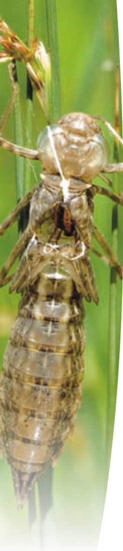
Exuvie (=mue) de larve de libellule