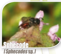
Sphécode [ Sphecodes sp.]