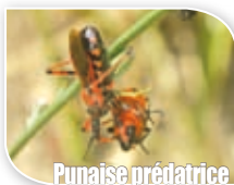
Punaise prédatrice (Réduve)