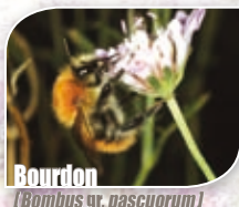
Bourdon ( Bombus sp. pascuorum )

✚ L'abeille domestique ( Apis mellifera ) ou abeille des ruches ou encore abeille mellifère est élevée par l'homme pour la récolte du miel et des produits de la ruche (apiculture). Moins velues que les bourdons, elles sont facilement reconnaissables à cette même corbeille dans laquelle elles amassent le pollen pour former une petite boulette sur la face externe des pattes postérieures.