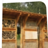
Hôtel à abeilles

➤ L'association Arthropologia , qui a une expérience importante dans l'éducation à l'environnement, coordonne les actions pédagogiques. Les interventions seront réalisées par leurs animateurs, ceux des Espaces Verts la ville de Lyon et de la FRAPNA Rhône.