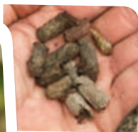
Nids de mégachiles